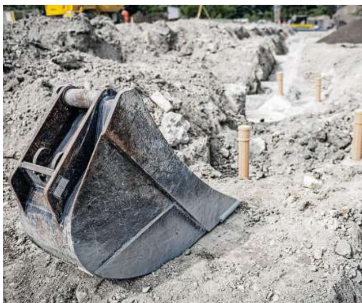
Bei der Arbeit kommen schwere Maschinen zum Einsatz.