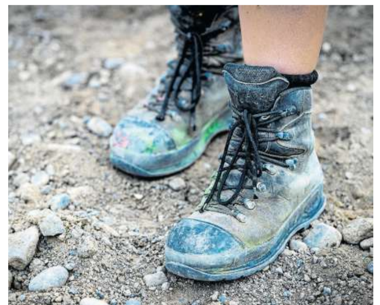
Strassenbauer arbeiten bei jedem Wetter draussen.